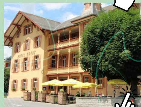
Hotel Kreuz Romoos