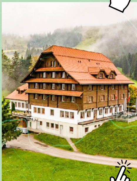
Hotel Kurhaus Heiligkreuz