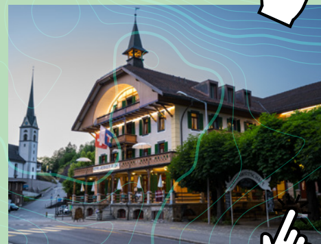
Hotel Kurhaus Flühli