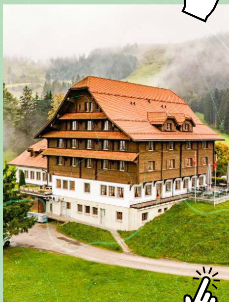
Hotel Kurhaus Heiligkreuz