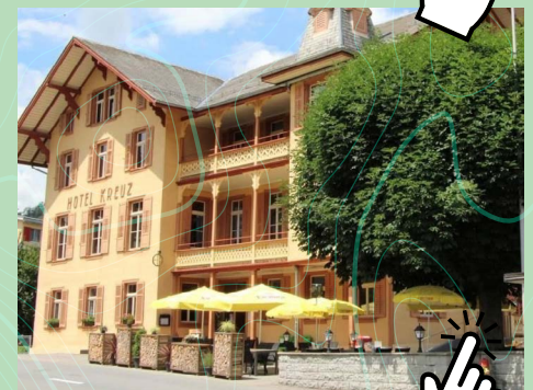
Hotel Kreuz Romoos