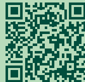
Kraftort Heiligkreuz Barfussweg & Kraftbaum