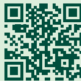
Hotel Kurhaus Heiligkreuz