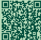
Kraftort Heiligkreuz Seelensteg