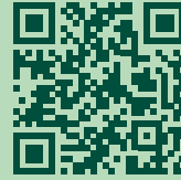
Merängge-Hochburg Kemmeriboden Bad