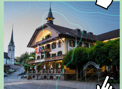
Hotel Kurhaus Flühli