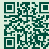
Hotel Kurhaus Flühli